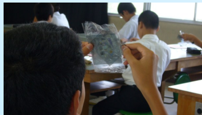
えっ! 光って向きがあるの? (昨年第4回 9/22)