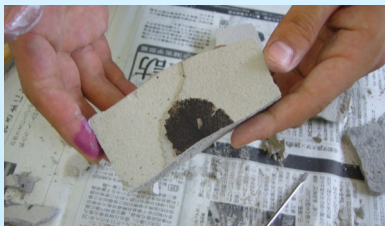
DNAを取り出そう (昨年第2回 6/16)

参加申し込みは、青陵高校ホームページ内の理科実験教室申し込みページから、必要事項を入力の上、実施日の3日前までをお願いします。傷害保険に加入しますので締切を守ってくださいね。