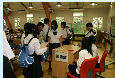
スタンプラリー名所？図書館

校内は自由見学できますが、さらにスタンプラリーで校内探検をしましょう！図書館、トレーニングルーム、進路閲覧室、CPルーム、LL教室、購買・食堂などの施設を校内地図を頼りに探索してください。ラリーポイント制で簡単なクイズに正解するとスタンプがもらえます。全箇所巡ると完成。レアな青陵オリジナルグッズをゲットできます。