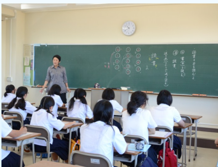
楽しく漢文をしています！